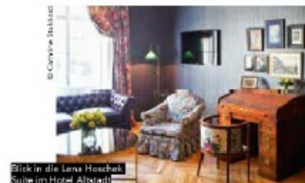
Blick in die Lena Hoschek Suite im Hotel Altstadt

Reservation: guestservices.vienna@sofitel.com