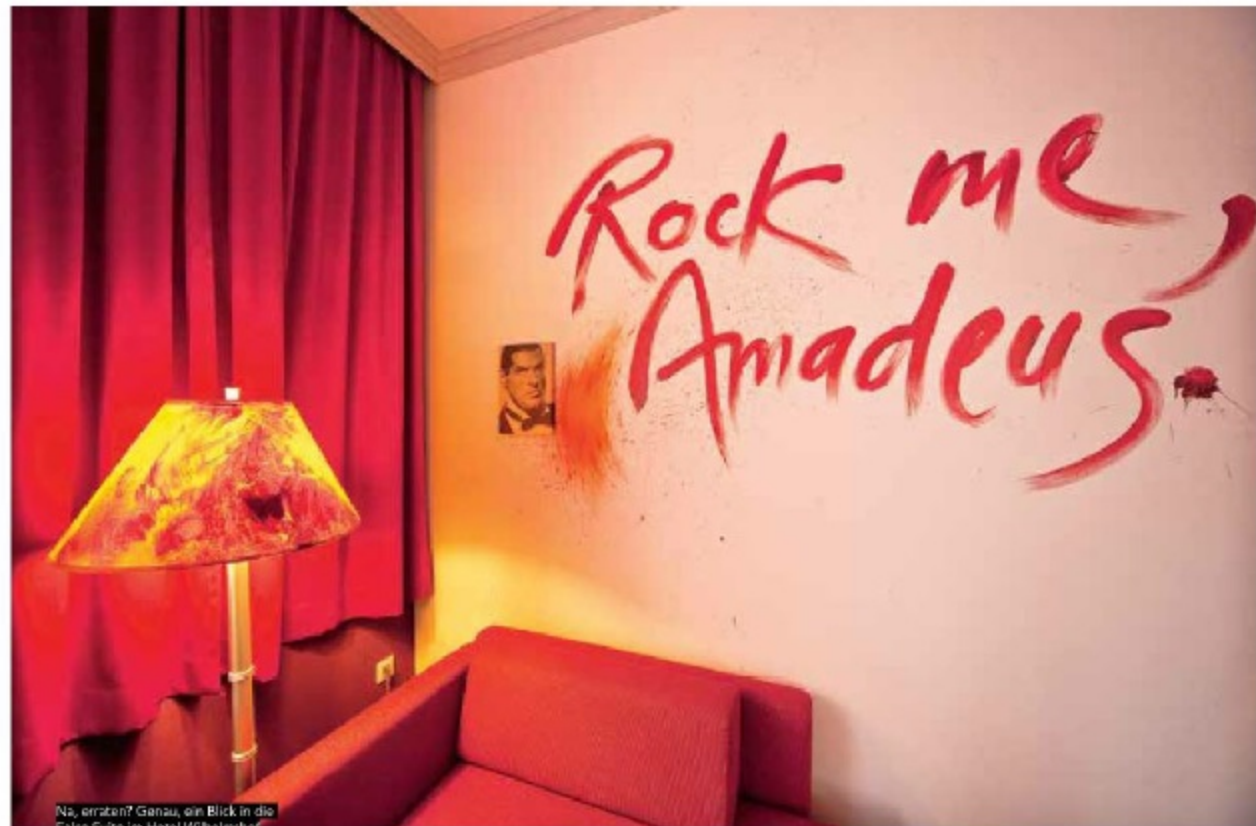
Na, erraten? Genau, ein Blick in die Fälsch-Suite im Hotel Wilhelmshof