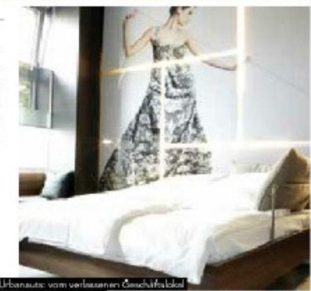
Urbanauts: vom verlassenen Geschäftslokal zum hippen Hotelzimmer

INFO: www.derwilhelmshof.com www.urbanauts.at www.wien.camping.at www.airbnb.at