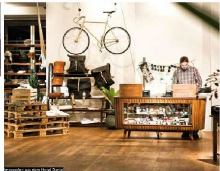
Impression aus dem Hotel Daniel

den Komfort eines Hotels zu verzichten, dem bieten sich hier viele Möglichkeiten.