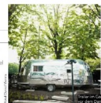
Hotel Daniel Vienna

Wildnis. Wem spektakuläre Innenarchitektur nicht Abenteuer genug ist, der kann vor den Toren Wiens im Nationalpark Donau-Auen zelten. Zumindest wenn sie/er an dortigen Expeditionen oder anderen Veranstaltungen teilnimmt. Wilderness. If unusual interior architecture isn't